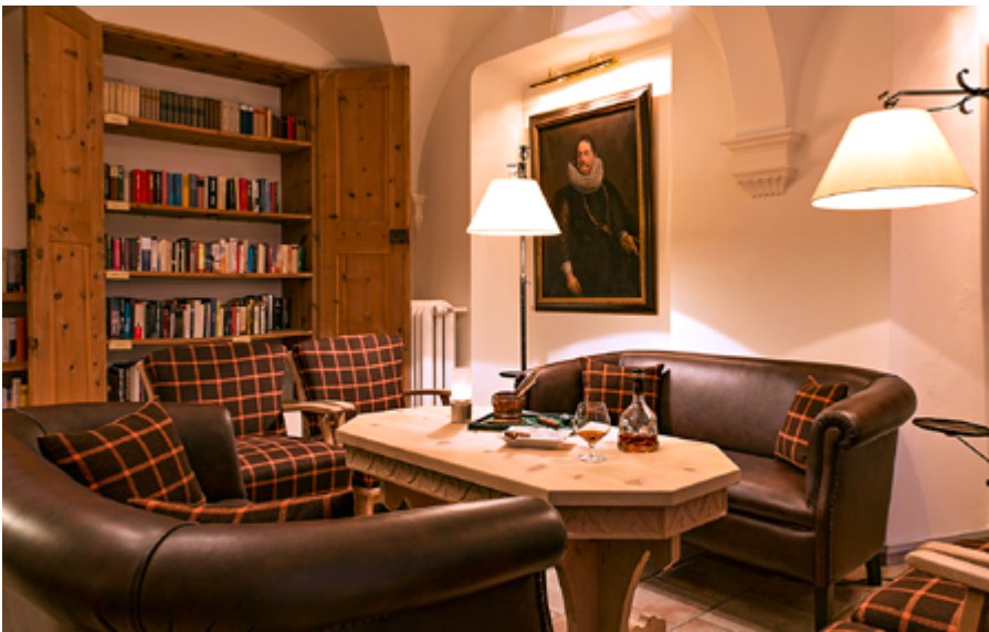
Vielseitige Gastronomie im Parkhotel Margna: Im Grillroom und Hotelrestaurant, in der Enoteca & Osteria Murütsch und in der Gaststube «Stüva Josty» genießen die Gäste eine Vielzahl an überraschenden kulinarischen Kreationen.