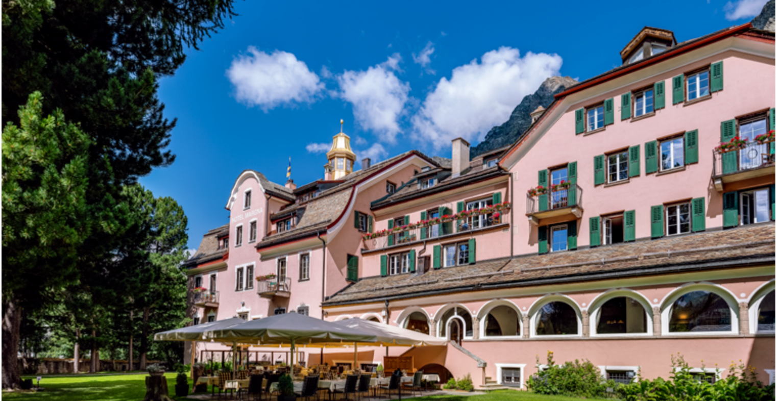
Die neue Küche im Parkhotel Margna, Sils i.E.: